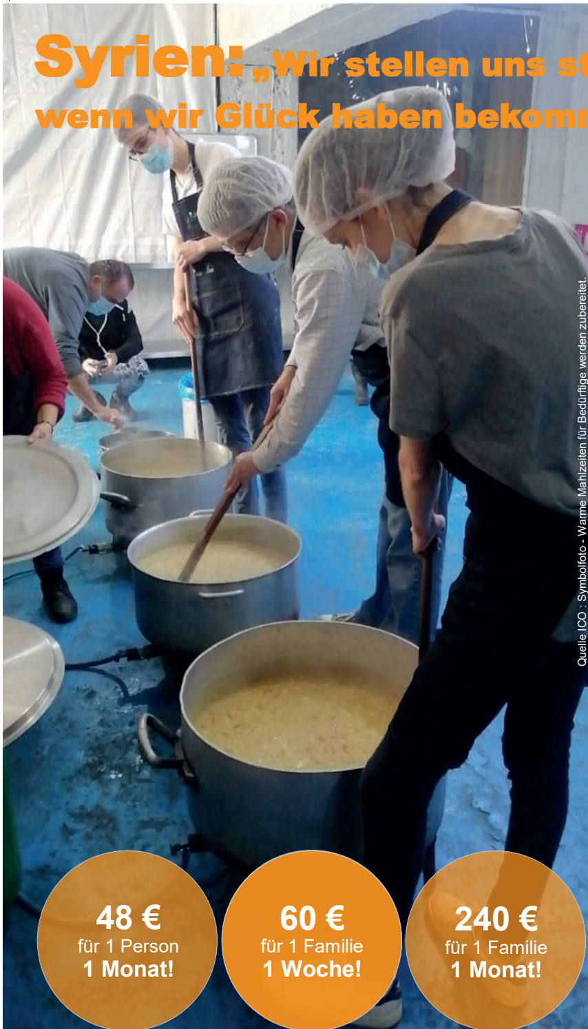
Symbolfoto - Warme Mahlzeiten für Bedürftige werden zubereitet.